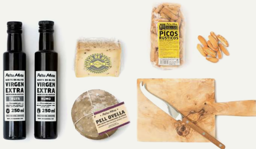
TABLA DE QUESOS Y ACEITES

PACK_01112 Queso de oveja pell florida 450 g · Queso de oveja curado con pimienta negra 350 g · Aceite saborizado trufa 250 ml · Aceite saborizado humo 250 ml · Pico campero rústico · Tabla cuadrada grande de madera Cinq Étoiles · Cuchillo para queso con mango de teca Sabre.